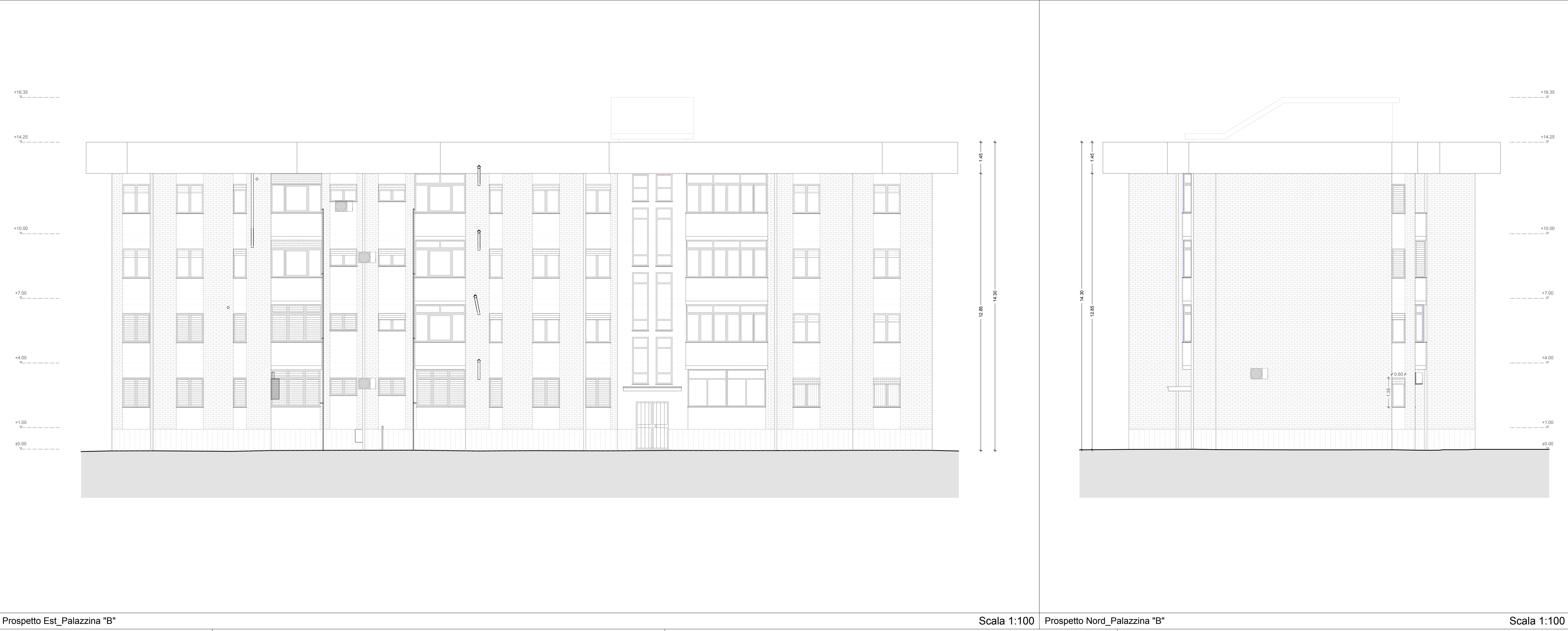
Prospetto Est_Palazzina "B" Scala 1:100 Prospetto Nord_Palazzina "B" Scala 1:100