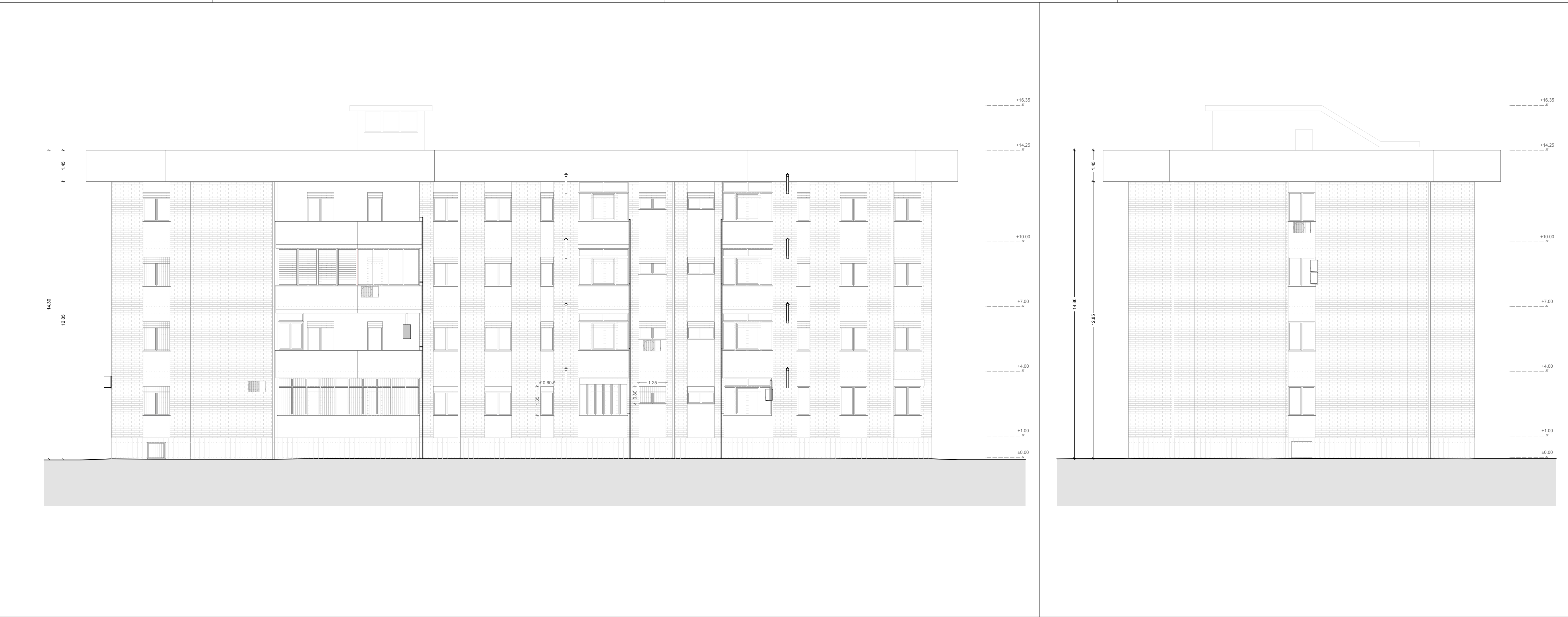
Prospetto Ovest_Palazzina "B" Scala 1:100 Prospetto Sud_Palazzina "B" Scala 1:100